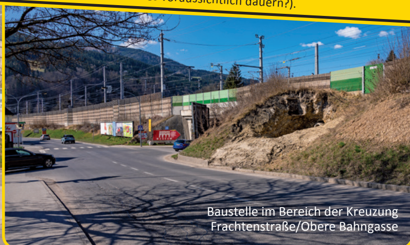
Baustelle im Bereich der Kreuzung Frachtenstraße/Obere Bahngasse

EINEN AUSFÜHRLICHEN ÜBERBLICK DER BAUPROJEKTE finden Sie auf der Rückseite (Wer baut? Wo wird gebaut? Wie lange wird es voraussichtlich dauern?).