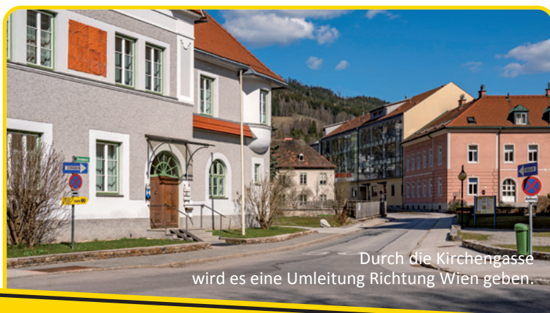
Durch die Kirchengasse wird es eine Umleitung Richtung Wien geben.