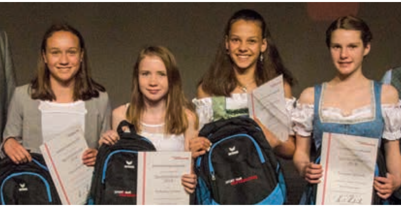
Herta Reich Gymnasium