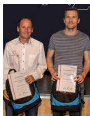
Fun-Sports Tri Team