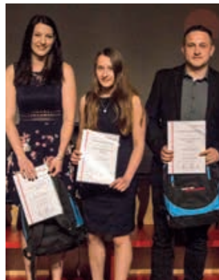
Mixed Martial Arts Sportsclub