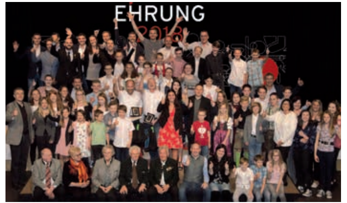
Die Stadtgemeinde gratuliert allen SportlerInnen!