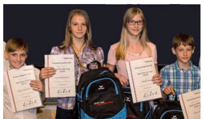
Naturfreunde MZ - Sportklettern