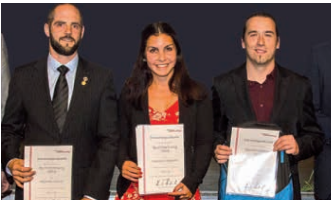
HAP KI DO Verein ASKÖ Mürzzuschlag