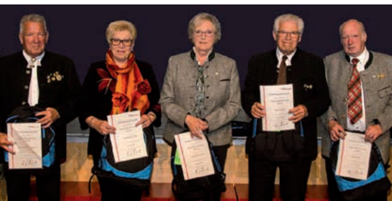
Privilegierte Schützengesellschaft 1652