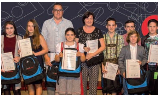
Judoclub ASKÖ Mürzzuschlag