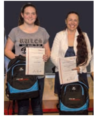
ÖGV Vip Dogs