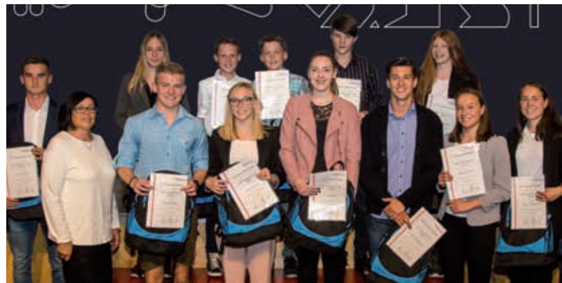
Mürztaler Leichtathletik Gemeinschaft - Sparkasse