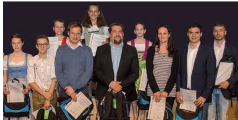
SC Raiffeisen Schwimmen