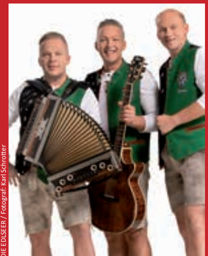
DIE EDLSEER