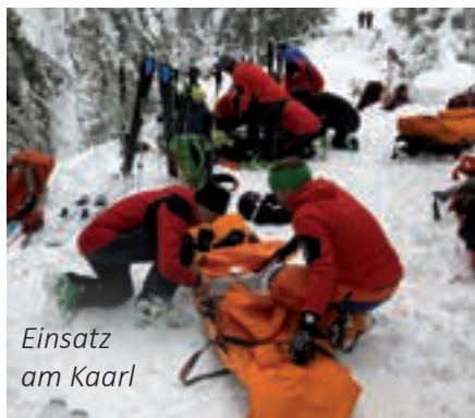
Einsatz am Karl

Damit verbunden war ein Einsatz am „Karl“, wo ein Skitourist einen Beinbruch erlitten hatte und versorgt werden musste. Es folgten unter anderem fünf Einsätze auf der Rax, bei denen teilweise erheblich verletzte oder nicht mehr zum Abstieg fähige Alpinisten Hilfe benötigten. Steile Schneefelder oder vereiste Steigbedingungen waren die häufigste Ursache für diese Einsatzserie. Und sogar noch Ende Mai verunglückte ein Bergsteiger am immer noch sehr winterlichen Reistalersteig tödlich.