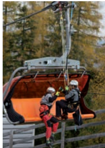
Flugbergeübung am Stuhleck

Es folgten drei weitere Einsätze auf der Rax, wo glücklicherweise die gesuchten Personen unverletzt blieben. Die Bergrettung Mürzzuschlag bedankt sich bei den Gemeinden, Sponsoren, Förderern, Gönnern und Freunden der Ortsstelle. Mit den finanziellen Mitteln konnte ein allradbetriebenes Quad angeschafft und eine Garage gebaut werden.