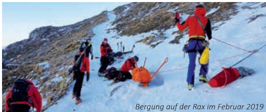
Bergung auf der Rax im Februar 2019