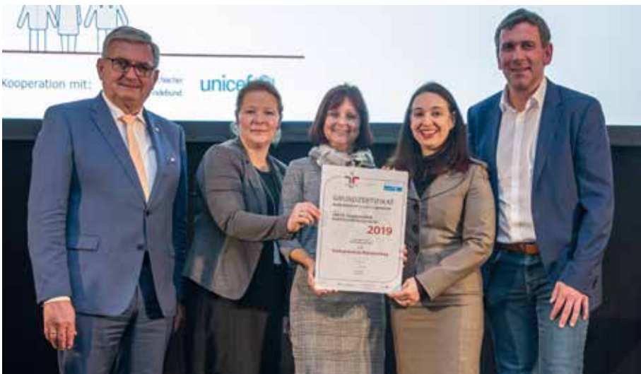
Am 26. November bekam die Stadtgemeinde Mürzzuschlag das Grundzertifikat „Audit familienfreundliche Gemeinde“ sowie das UNICEF-Zusatzzertifikat Kinderfreundliche Gemeinde 2019 durch das Bundeskanzleramt verliehen.

Stadtwerken, errichtet werden. Durch den Bau eines neuen Ressourcenparks, in Zusammenarbeit mit den Nachbargemeinden wird auch dieser Teil des derzeitigen Bauhofes neu aufgestellt.